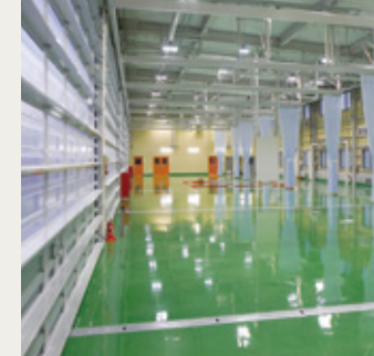
メンテナンスストール

また、油脂貯蔵庫と産業廃棄物置場を独立して設けて管理し、外周の施設景観も含めて周辺環境への影響と安全には十分に配慮した設計をしております。