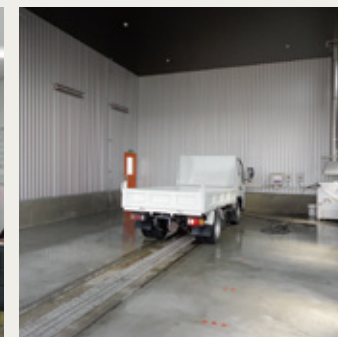
屋内下回り洗車場