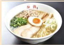
浜鶏(はまど〜り) ラーメン