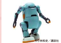
あるくマカトロウィーゴ