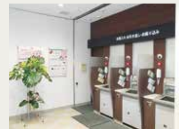
風除室・ATMコーナー