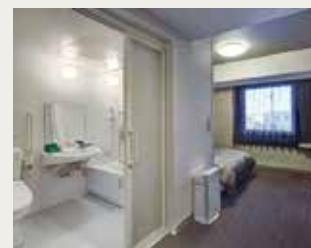
バリアフリールーム