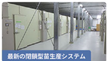
最新の閉鎖型苗生産システム

複数のワクチンを同時に接種する技術を有しており、キュウリ3種混合ワクチン接種苗の実用化に世界で初めて成功し、販売をしています。カボチャの2種混合ワクチン接種苗も実用化し、販売していく予定です。