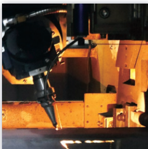
板金加工事業 SHEET METAL