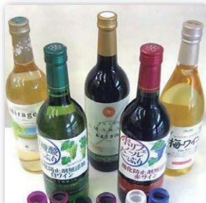
包装事業 CAP SEAL