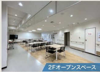
2F オープンスペース