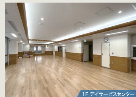
1F デイサービスセンター