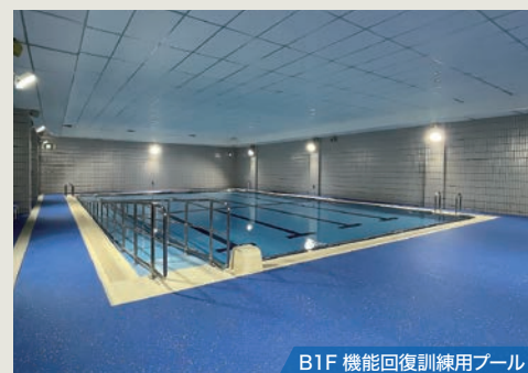
B1F 機能回復訓練用プール