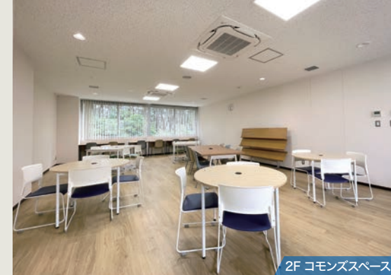
2F コモンズスペース