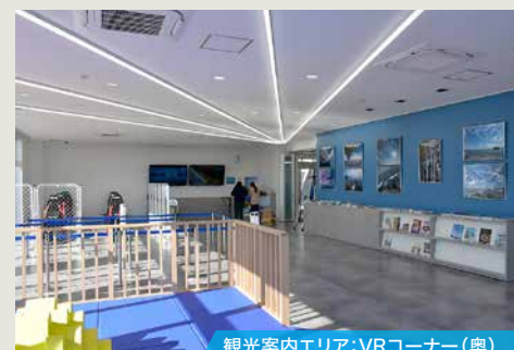
観光案内エリア:VRコーナー(奥)