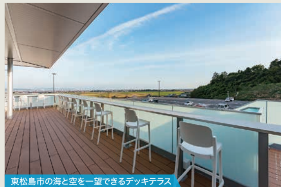
東松島市の海と空を一望できるデッキテラス