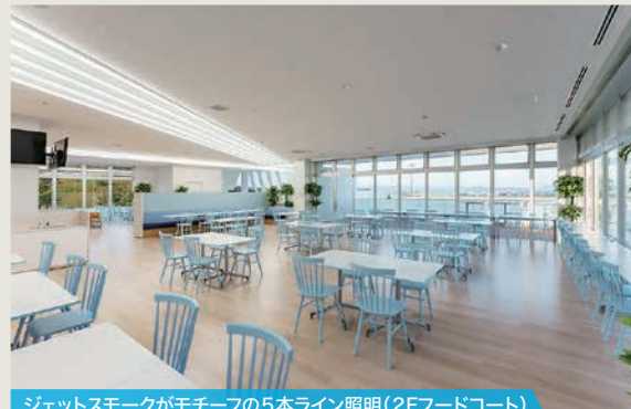
ジェットスモークがモチーフの5本ライン照明(2Fフードコート)