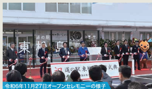
令和6年11月27日オープンセレモニーの様子

この度、新たに市観光ビジョンである"絆交流"から育む「住んでよし、訪れてよし、そして、営んでよし」の観光地域づくりの各施設と連動しながら、地域の活性化を図るための活動の拠点(広域型地域活性化拠点)道の駅「東松島」の整備事業に、久慈設計グループが参画をさせていただきました。生産者と消費者が一体となった地域経済の発展、地産地消から広がる輪に人と人が繋がる交流の場として、ブルーインパルスに施設デザインの着想を得た新しい道の駅がオープンしました。