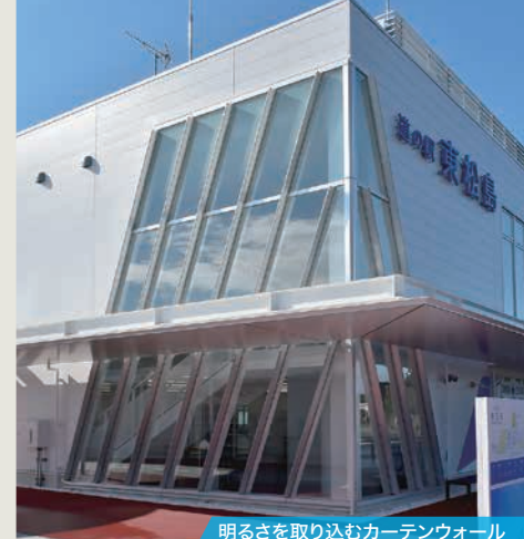
明るさを取り込むカーテンウォール

地域振興施設棟1階は産直物販だけでなく地域生産物加工施設があります。地場製品の認知度向上、販路拡大に寄与します。2階のフードコートは100席を完備し、ブルーインパルスの飛行訓練を眺められる展望デッキを配置することで開放的な空間としております。道路休憩施設棟は24時間利用可能なトイレや、授乳室の他、観光案内所を配置いたしました。さらにキッズスペースやVRコーナー等のエンターテインメント性を付加することで多くのお客様に楽しんでいただける施設としております。