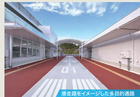
滑走路をイメージした多目的通路