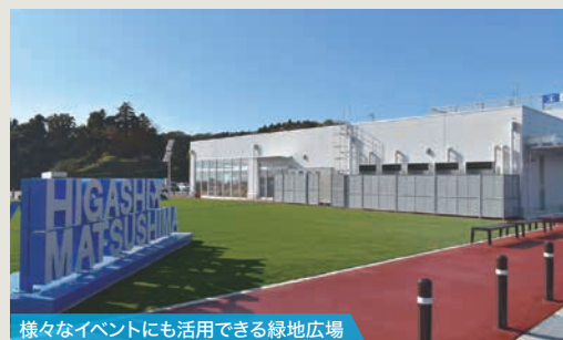
様々なイベントにも活用できる緑地広場