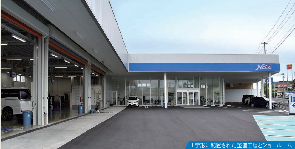
L字形に配置された整備工場とショールーム