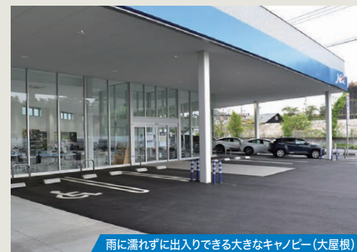
雨に濡れずに入出りできる大きなキャンピー(大屋根)

整備工場の開口部には、通常的大型スライドドアにシートシャッターも加えるく2段式>とすることで、冬場でも冷気を遮断した屋内で作業でき、車の出し入れの際にはスピーディーに開閉ができます。工場併設店舗とすぐわかるように整備工場全体が道路から見える配置とし、ショールームで整備作業を待つ間も、テーブルから整備の様子が見え、お客様が安心感を持てるよう工夫しております。