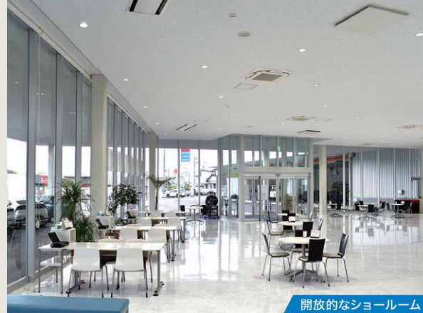
開放的なショールーム