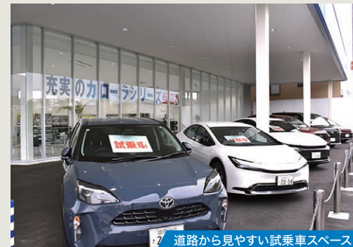
道路から見やすい試乗車スペース