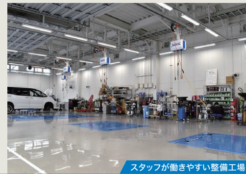
スタッフが動きやすい整備工場