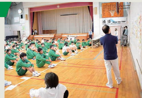
張り出したポスターの説明を聞く生徒達

全校生徒133名と先生方22名の合計155名にご参加いただきました。ローテーションで校舎内の各会場を巡回する方式で実施。自分たちの学校がどのようになるのに興味を持った生徒が多く、また、現校舎は将来的に解体されて無くなってしまいますので、校舎について振り返る「学校マップ」作成を真剣に取り組む様子が見られました。