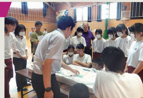
模型を使った新校舎の配置計画について説明を聞く

全校生徒72名と先生方14名の合計86名にご参加いただきました。授業1時間分を使い、新設中学校の計画案説明プログラムを実施。生徒達は真剣なまなざしで計画案の説明を聞き、意見を出し合いました。ポスターや模型を積極的に見に行き、友達同士で様々な意見を自発的に交換し合う生徒が多く、とても印象的でした。