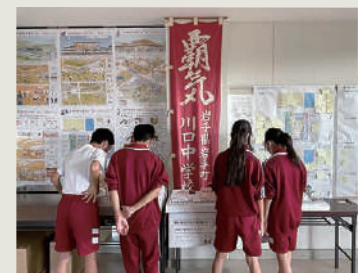
昇降口前に模型展覧会を設置