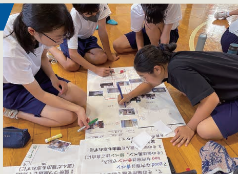
現校舎の良い点、悪い点をまとめた「学校マップ」を作成

全校生徒26名と先生方10名の合計36名にご参加いただきました。授業2時間分を使い、2つのプログラム ①「空間ハンティング+学校マップ作成」、②「新設中学校計画案の説明」を実施しました。生徒と先生の皆さんで、新しい学校づくりに真剣に取り組んでいただきました。