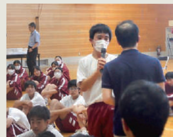
生徒から自発的に質問