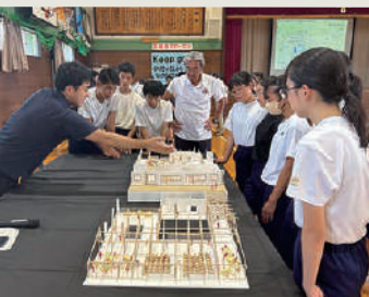
模型を使い新校舎の計画案の説明