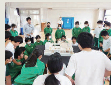
小人になったつもりで模型を見る