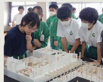
模型を見ながら自分の考えを巡らす