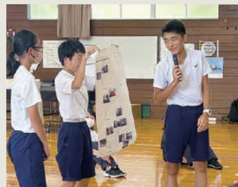
作成した学校マップの発表