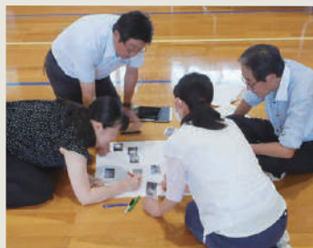
先生チームも頑張りました!