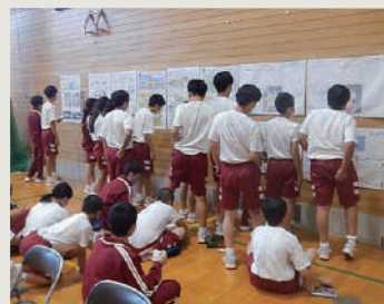
新校舎についてそれぞれの意見を書き出す