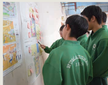
様々な意見について友達と議論