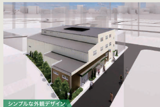
シンプルな外観デザイン