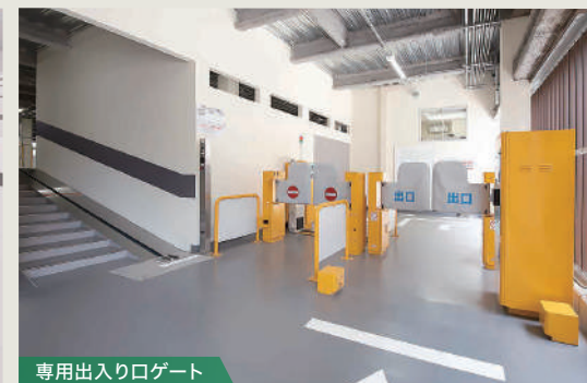
専用出入りロゲート