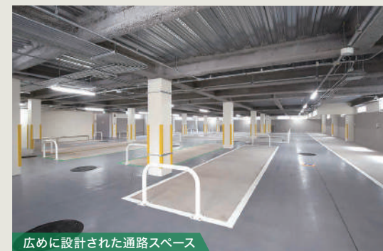
広めに設計された通路スペース

本施設は、自転車および原付バイクの駐車スペース確保はもちろんの事、子供乗せ自転車専用スペースの分けをし、子育て世代にも利用しやすい施設としております。また利便性を高めるために、地下1階、地上3階の重層する駐車スペースに対しては、上方向の移動を補助するコンベア設備の設置や自転車等を持って移動する側の階段・スロープに対し、建物の反対側に歩行専用の階段を設けるなど、2方向での動線を計画し、混雑時などに搬入、退出が交差しない計画としてスムーズな運行が行えるよう配慮しました。屋根部分の太陽光発電パネル、また自然通風など、再生可能エネルギー利用にも取り組みました。