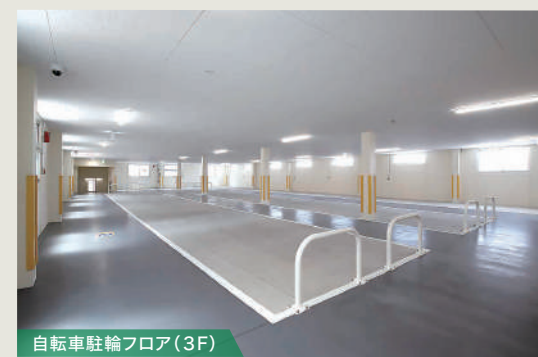
自転車駐輪フロア(3F)