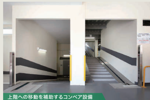
上階への移動を補助するコンベア設備