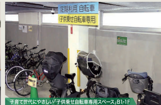
子育て世代にやさしい「子供乗せ自転車専用スペース」B1・1F