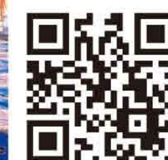
現地の様子を チェック!