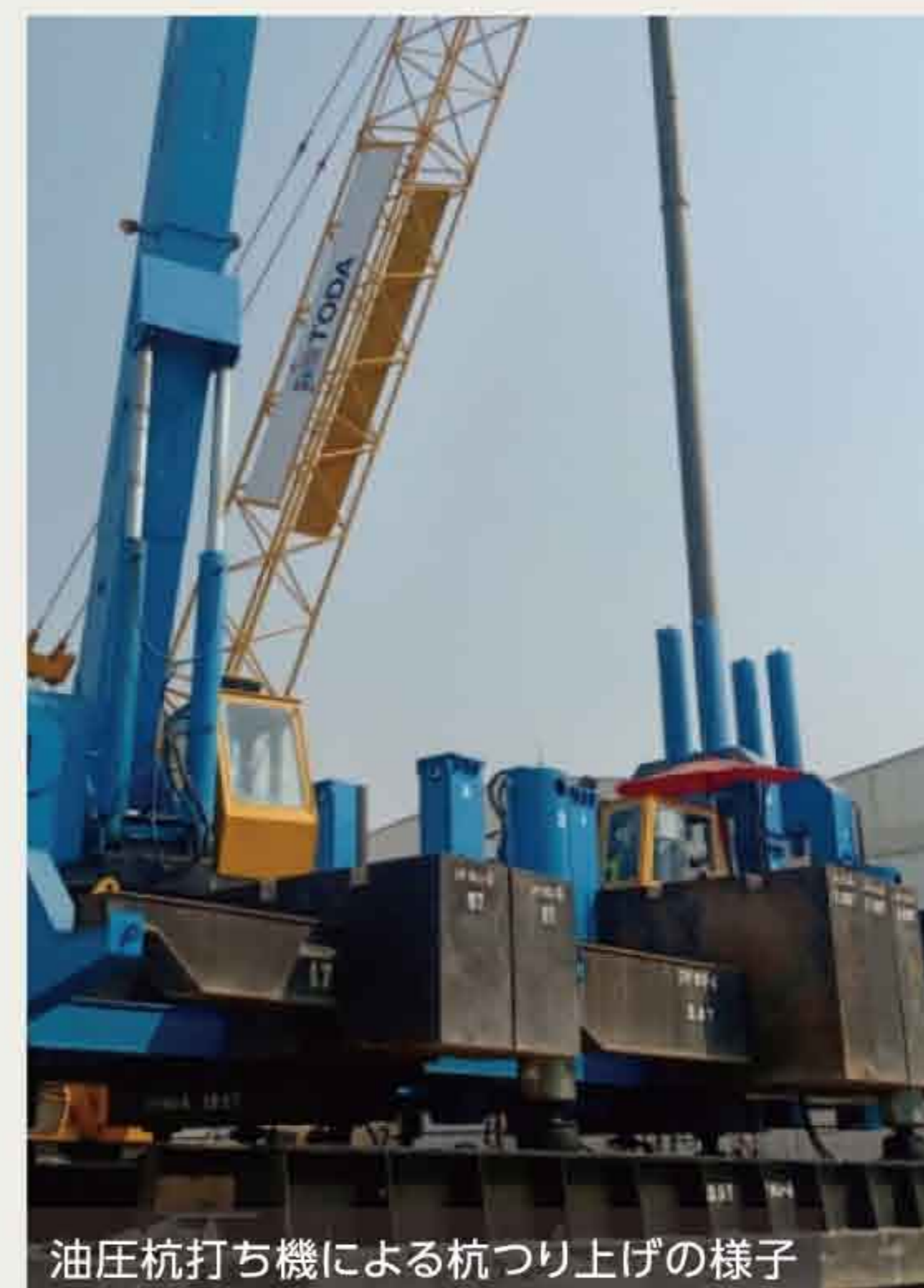
油圧杭打ち機による杭つり上げの様子