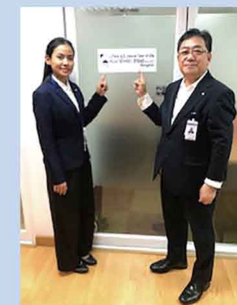
タイ王国にて法人設立