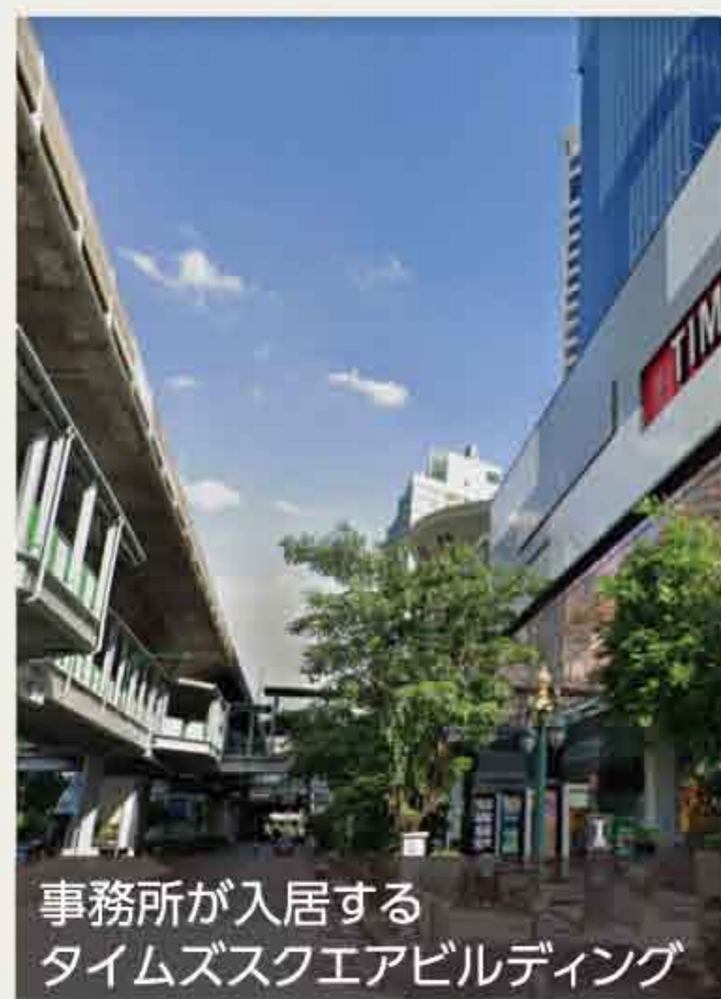
事務所が入居する タイムズスクエアビルディング