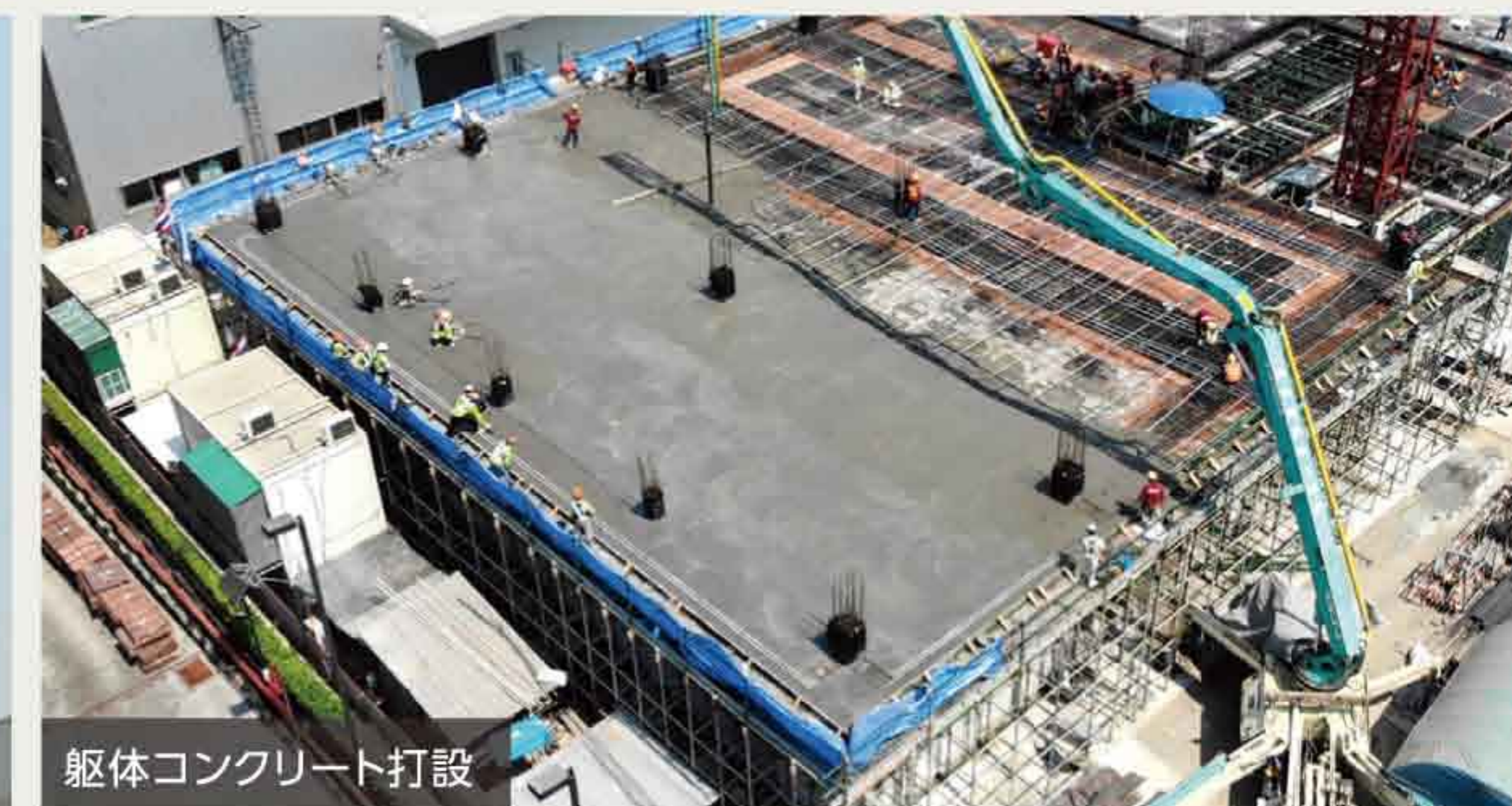
躯体コンクリート打設

パンデミックとなったコロナウイルスにより現地現場はリモートによる監理へと移行になりました。しかし感染症対策を十分に行い工事工程に支障のない様に取り組みました。