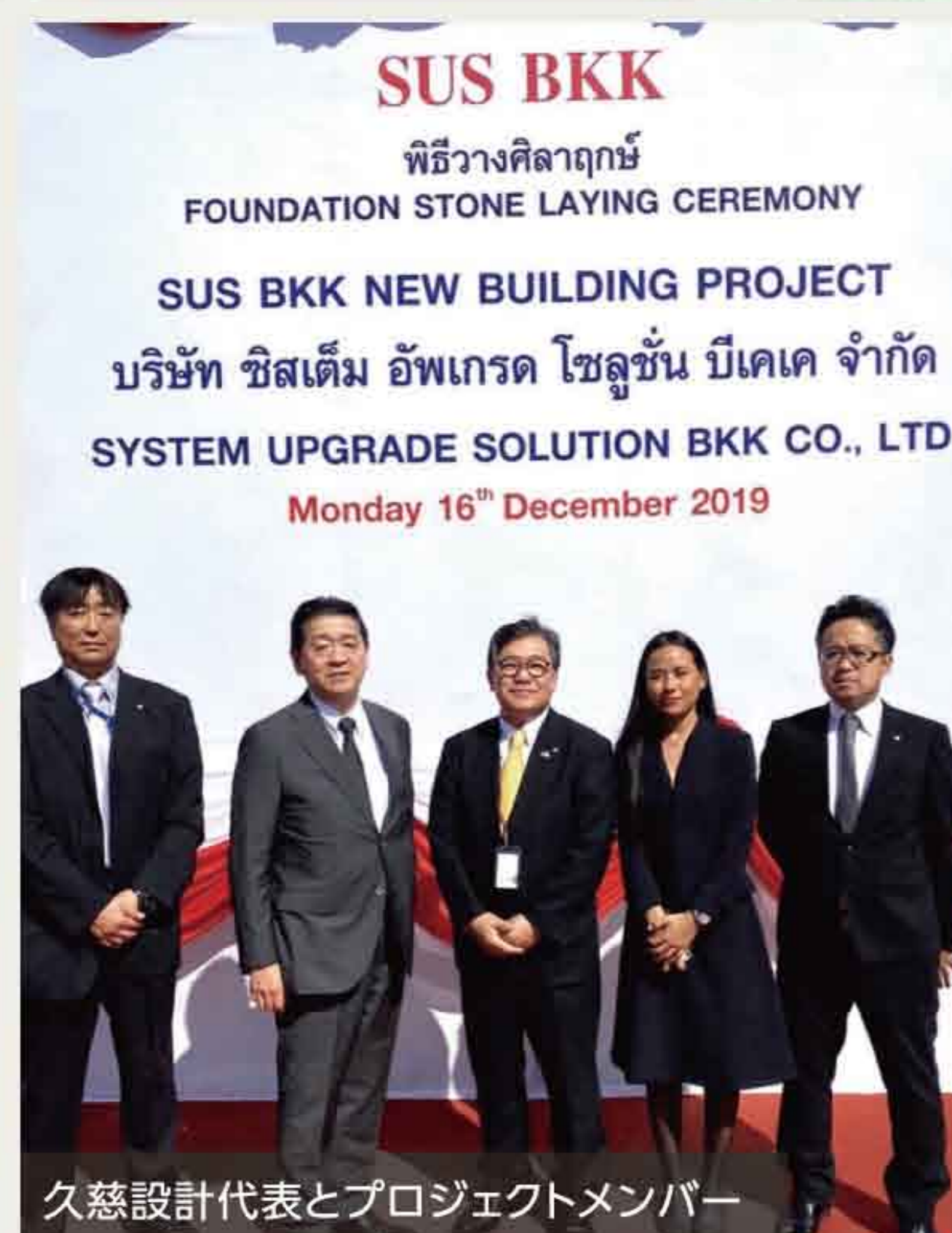
久慈設計代表とプロジェクトメンバー