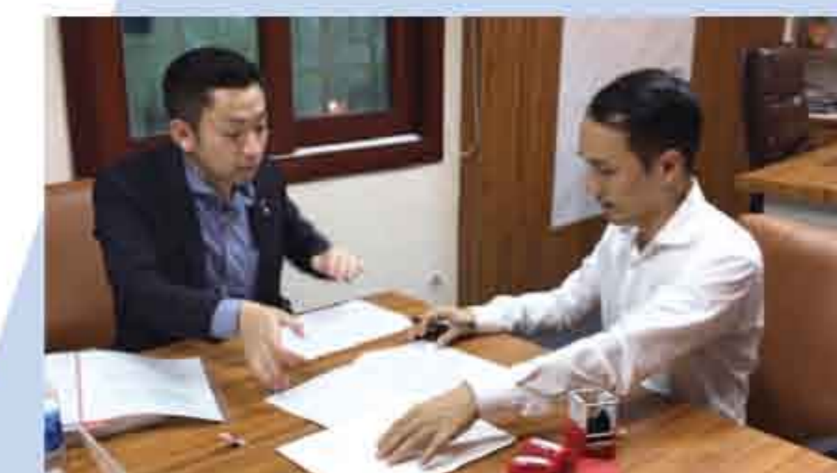
ベトナムホーチミン連絡事務所開設