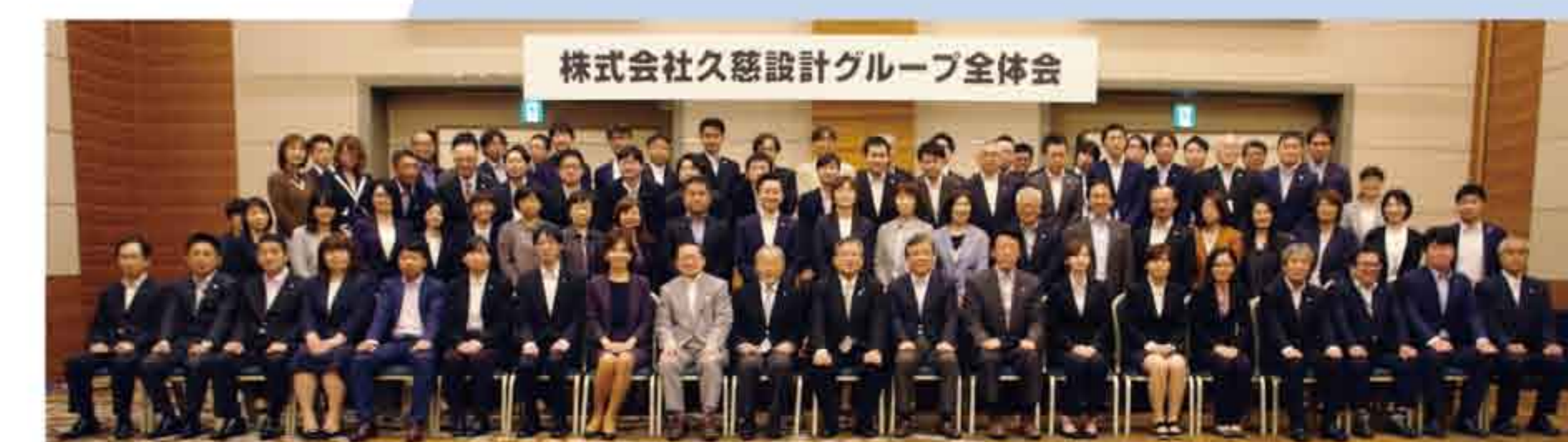
株式会社久慈設計グループ全体会 2019.6.29 久慈設計グループ全体会(仙台市にて)