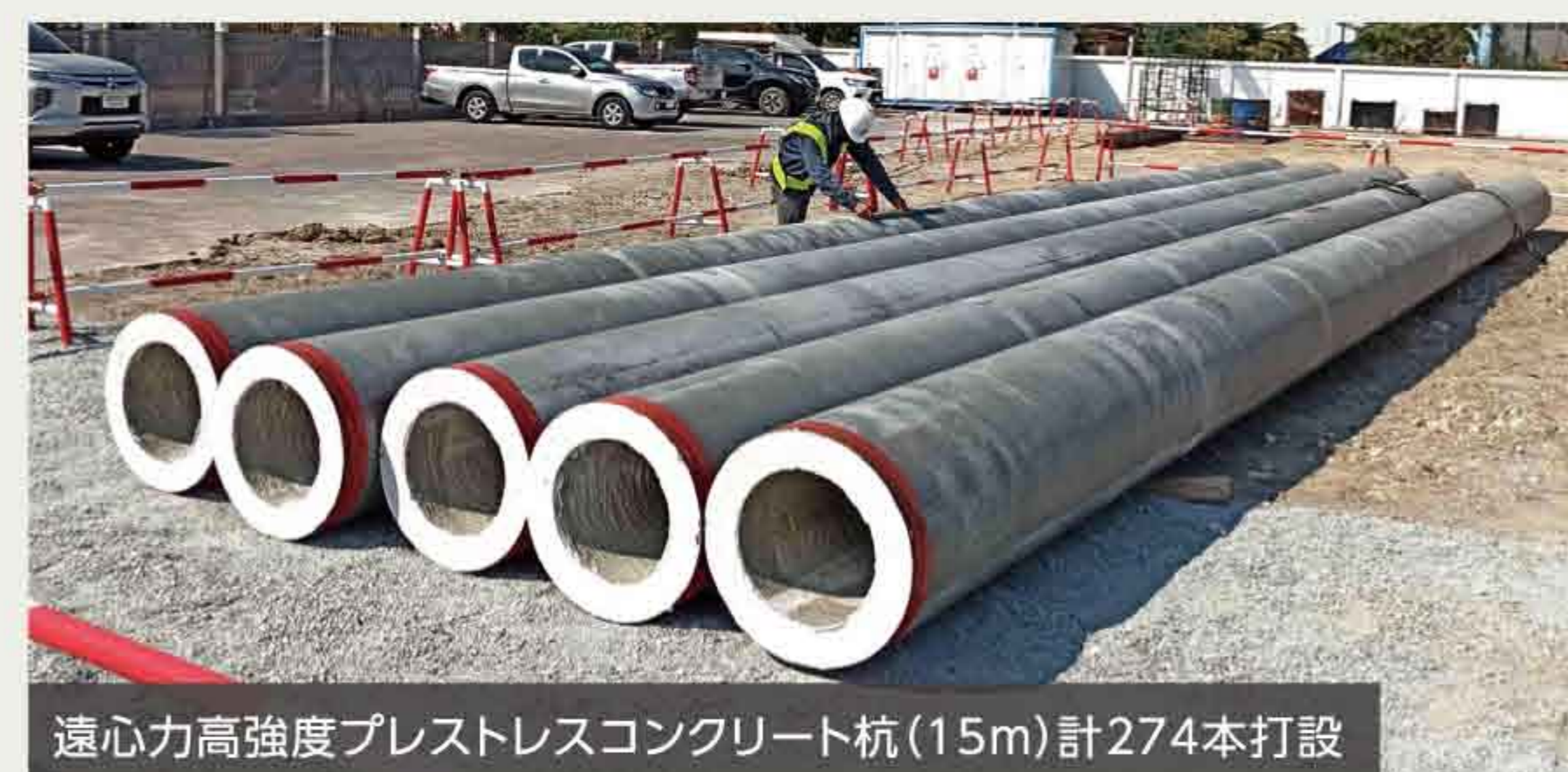
遠心力高強度プレストレスコンクリート杭(15m)計274本打設

タイの地鎮祭は、仏教+バラモン教スタイルで、タイでは「進歩・前進」を意味する「9」という数字が好まれます。縁起が良いとされる為、9人の僧侶が参加され、工事の安全を祈念しました。