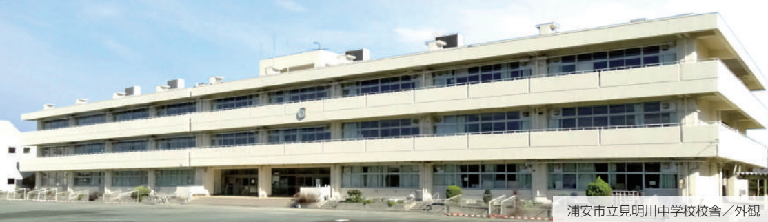
浦安市立見明川中学校校舎／外観