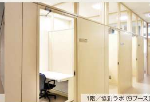
1階/協創ラボ(9ブース)