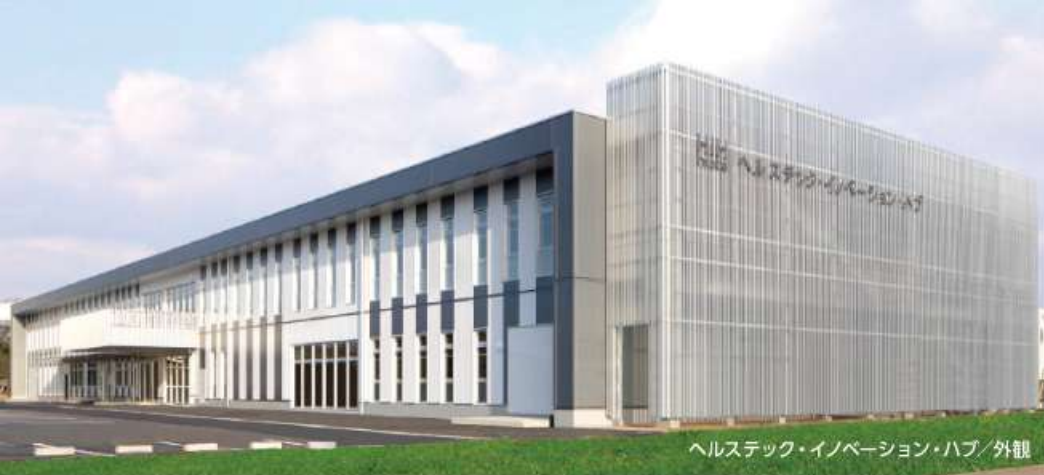
ヘルステック・イノベーション・ハブ/外観