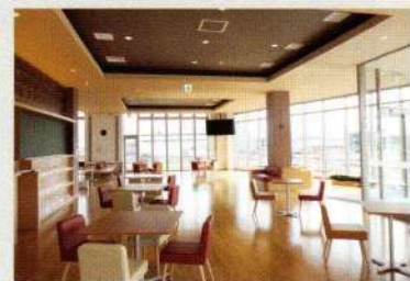
1階 マガジラウンジ