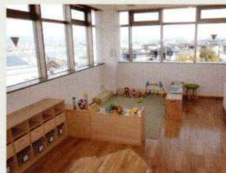
3階 ちびっこ保育ルーム

3階は子育て世代活動支援センターとして、乳幼児や小さなお子様の一時預かりや親子での遊び、子育て世代間の交流が可能なスペースを確保しました。子育てに関する情報交換の場やキッチンスタジオや飲食スペースなど親子での交流を図る諸室を設け地域が支える子育てを実践する施設として計画しました。