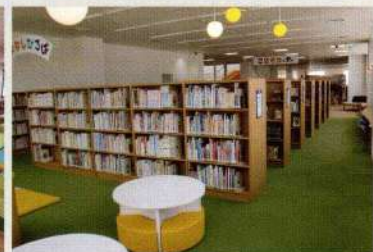
2階 図書室・こどもコーナー