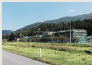
高台に建設が進む災害公営住宅