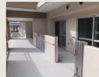
バルコニーからの避難経路