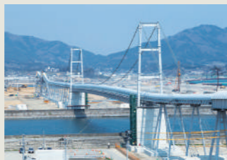
嵩上げの土砂を運ぶベルトコンベア

平成23年3月11日午後2時46分に三陸沖を震源に発生した東日本大震災は、我が国の観測史上最大規模の地震(マグニチュード9.0/最大震度7)として、東日本の太平洋側全域に未曾有の被害をもたらしました。あの日から4年が経過する被災地では瓦礫の処理が3年の年月を要して平成26年3月末で完了し(福島県の一部地域を除く)、浸水した地域の一部では土地の嵩上げが行われています。高い所では10mを超える嵩上げ計画もありライフライン・インフラ整備を含む「まちづくり」はまだまだ時間を必要とし、瓦礫が片づけられただけの地域も多くあります。一方、高台移転による事業では学校・病院などの再建が始まり、復興の歩みを進めています。いまだに仮設住宅で避難生活をする方は多く、入居を希望する災害公営住宅の整備には一層のスピードアップが必要です。