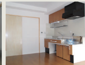
車椅子仕様流し台