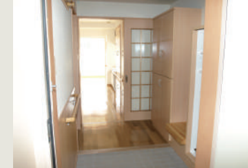
ベンチと手すりを設けた玄関周り

また車椅子利用の方にも使い易いよう通路幅を十分に確保し、キッチンにおいては流し台を車椅子対応の仕様とするなど、安心して快適な生活が送れるよう配慮いたしております。