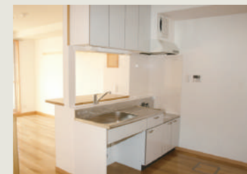
車いす対応キッチン