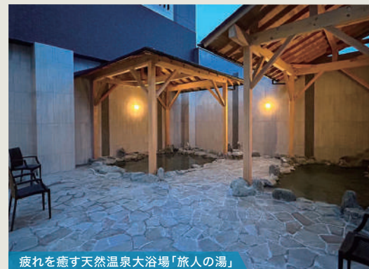
疲れを癒す天然温泉大浴場「旅人の湯」