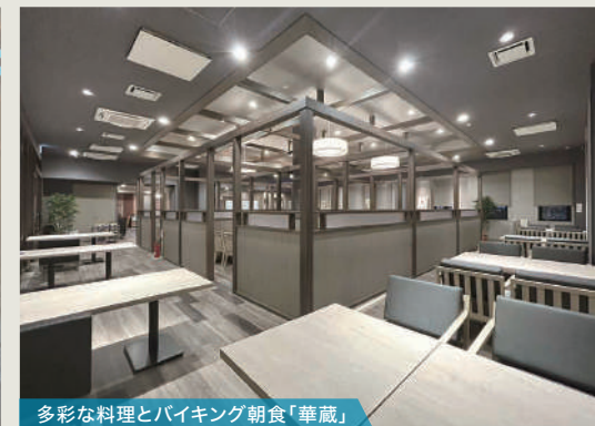
多彩な料理とバイキング朝食「華蔵」