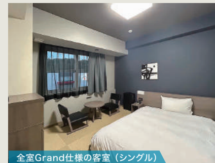
全室Grand仕様の客室 (シングル)

ホテルは落ち着きと高級感のあるデザインとし、滞在を楽しんで頂ける空間づくりに取り組みをいたしました。アメニティが充実した客室はローベットを採用し、広い空間と快適な設えとしており、小さいお子様連れでも安心してご利用いただけます。また、多目的にご利用いただける会議室や漫画コーナー、卓球コーナーなどを新たに整備いたしました。お客様の疲れをときほぐす天然温泉大浴場「旅人の湯」や、朝から一日を元気に過ごせる和洋朝食バイキングレストラン「華蔵」など、様々なホテルの過ごし方ができる施設としております。