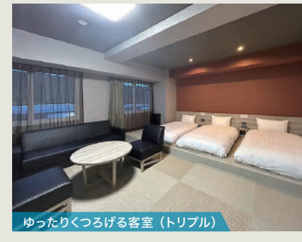
ゆったりくつろげる客室 (トリプル)