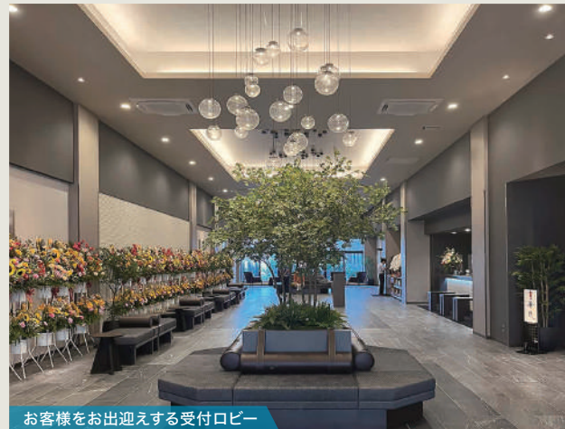
お客様をお迎えする受付ロビー