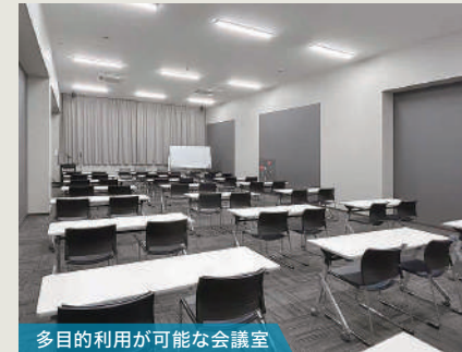
多目的利用が可能な会議室