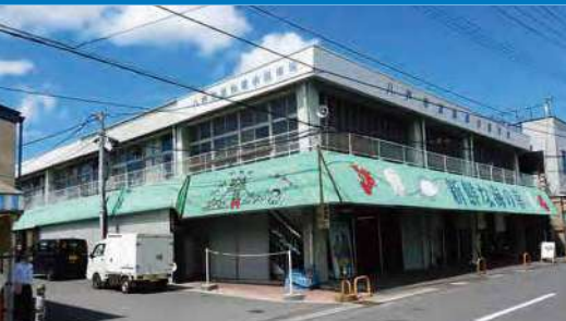
外観 / 改修前