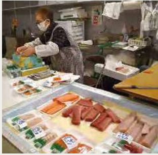
市場で新鮮な魚菜をチョイス!