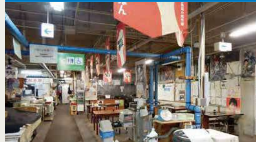
食堂 / 改修前