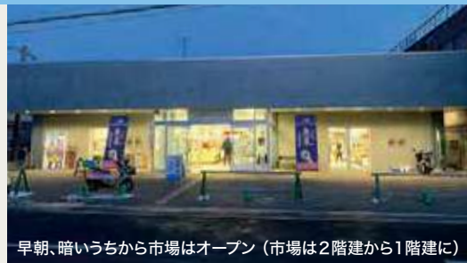
外観 / 改修後