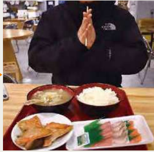
その場で新鮮な朝ごはんをいただきます!