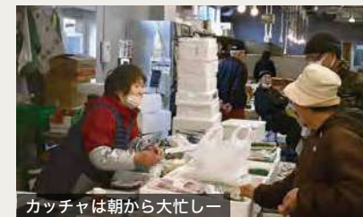
カッチャは朝から大忙しー