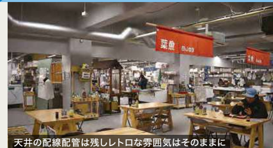
食堂 / 改修後