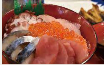
美味しいオリジナル海鮮丼をぜひ!!