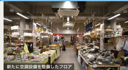
フロア / 改修後