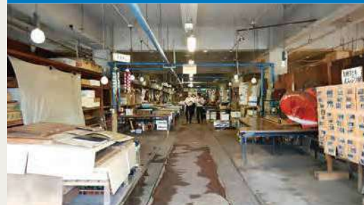
フロア / 改修前