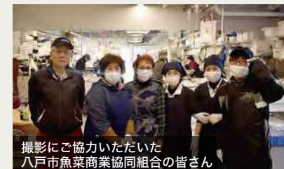
撮影にご協力いただいた 八戸市魚菜商業協同組合の皆さん

また開業当初のイメージを大切に、歴史風情ある海の街に調和するシンプルなデザインといたしました。外壁はグレー基調とし、壁上部のカラー鋼板は菱葺として魚の鱗をイメージしました。減築に伴い施設機能に支障がない様、必要諸室の確保はもちろんの事、必要最小限の内装とすることで、施設の多様な利用構成に対応できる設計といたしました。この度新たに空調設備も整備し、作業空間の快適さを実現しております。