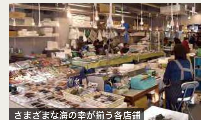
さまざまな海の幸が揃う各店舗