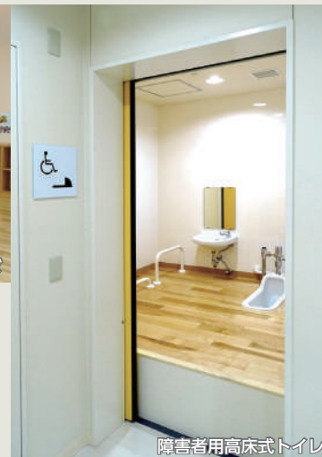
障害者用高床式トイレ

各フロアには車イス専用トイレの設置をはじめ、1階には重度障害をお持ちの方でもご利用頂ける高床式トイレを設けるなど、幅広く区民の皆さまにご利用いただけるような施設を目指し改修設計を行いました。