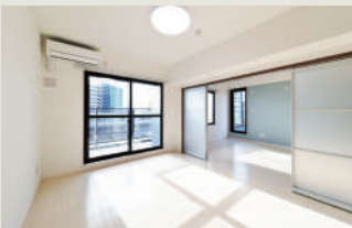
明るく広々とした洋室