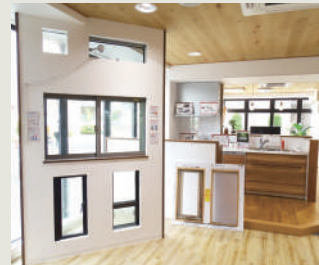
ドア・サッシ展示コーナー