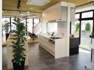
キッチン展示コーナー