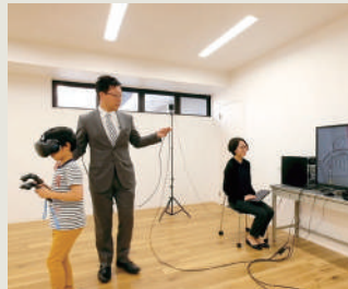
VR・設計コーディネート室