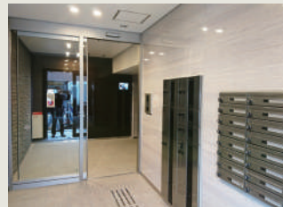
入居者様専用エントランス