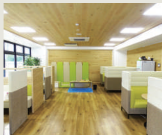
打ち合わせコーナー