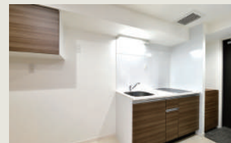
コンパクトに使いやすいキッチン

ワイケイホームの女性コーディネーターの皆様にご尽力頂き、内装細部に至るまで検討を重ね、デザイン性の高い洗練されたしつらえといたしました。また单身女性にも安心してご入居頂けるよう、オートロックや監視カメラ等セキュリティの充実も図りました。