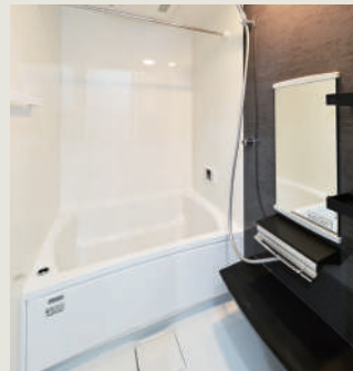
清潔感のあるバスルーム