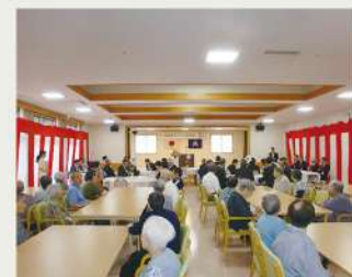
集いの場となる食堂・ホールと集会所 竣工・落成を祝う会