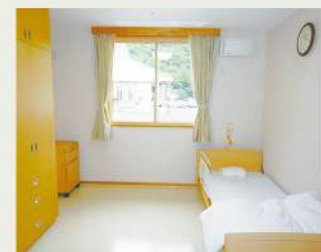
車椅子とストレッチャーが進入できる個室