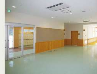
段差が解消されているエントランスホール