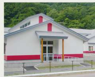
各入居棟ごとの非常口と避難スロープ

本施設は入居者様の利便性と安全性の確保の観点から各棟をつなぐ動線は極力単純化いたしました。ユニットごとに床面や案内表示をイメージカラー分けし館内の移動を容易にしております。また入居棟ごとに避難用スロープを設け自家発電設備を備えるなど災害時対応にも万全を期して設計いたしました。