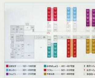
ユニットごとのイメージカラー