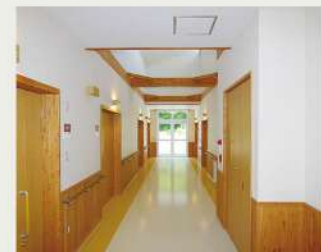
手すりと余裕の幅がある居室棟の廊下