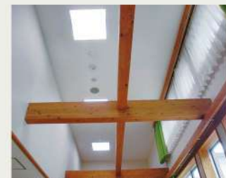
ハイサイドライトの明かりがある廊下の天井