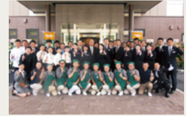
ルートイングループ会長兼CEOの永山勝利様とともに、オープニングセレモニーにて、笑顔とおもてなしの心を誓うスタッフの皆様