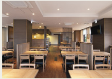
こだわりの無料朝食を愉しめるレストラン

施工地／神奈川県伊勢原市神戸417-1 竣工年月／平成27年6月 延床面積／4,814.83㎡ 構造／鉄筋コンクリート造10階建 客室総数／218室 (シングル180室 ダブル12室 ツイン26室) 無料駐車場数／平面駐車場27台／立体自走式91台 (ルートインホテルズ256店舗目)