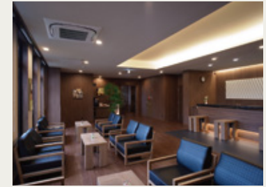
お客様をお迎える安らぎのロビー

施工地／岩手県大船渡市大船渡町字野々田8-11 竣工年月／平成28年5月 延床面積／4,923.61㎡ 構造／鉄骨造7階建 客室総数／210室 (シングル159室 ダブル6室 ツイン45室) 無料駐車場数／平面駐車166台 (ルートインホテルズ267店舗目)