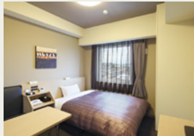
快適さを追求したシングルルーム(180室)