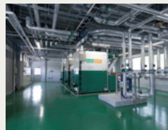
チップボイラー棟内部