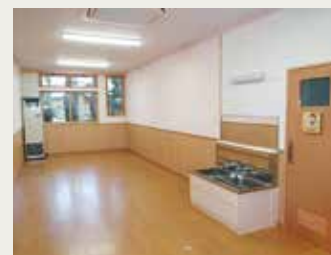
なかよしルーム(一時預室)