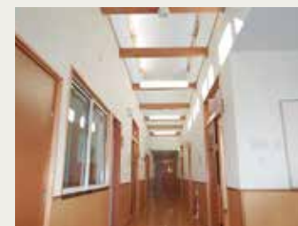
中廊下(トップライト)