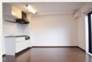
壁付型キッチンの2LDKプラン