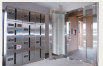
エントランスの宅配ボックス

岩手地所株式会社様が岩手県盛岡市に整備しました賃貸マンション「フェリオ仙北」は、ワンルームタイプ8戸と2LDKタイプ15戸からなる一般賃貸住宅です。外観はやさしい色合いの茶色系タイルを中心に、張り方にデザイン性を持たせ、落ち着きと高級感を与える外装計画としました。エントランスホールには不在時でも宅配等の荷物が受け取れる宅配ボックスを設置し利便性に配慮しながら、オートロックシステムを採用してセキュリティ強化にも努めました。また2LDK住戸のキッチン是对面型と壁付型の2タイプを用意しました。入居者の生活スタイルに合わせたお部屋をお選びいただけます。