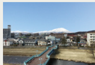
富士見橋からの南部片富士(岩手山)

本施設は戸建て住宅が建ち並ぶ静かな住宅地にあり、近隣の学校への通学など人通りも多く、また川の対岸からも目立つ立地であることから、温かみのある色合いを基調に、安らぎある住宅地の景観を損なわない色彩計画としました。各住戸内においては快適な室内環境の構築に配慮し計画しました。居室の開口部には二重サッシを採用し、断熱性能の向上に努めながら遮音性を確保、落ち着いて生活できる空間をご提供いたしております。