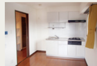
明るいダイニングキッチン