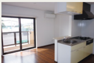
対面型のダイニングキッチン