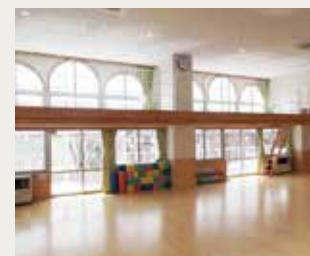
キャットウォーク(遊戯室)